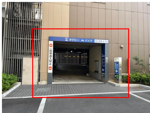
入口正面写真 （注）2025年11月撮影