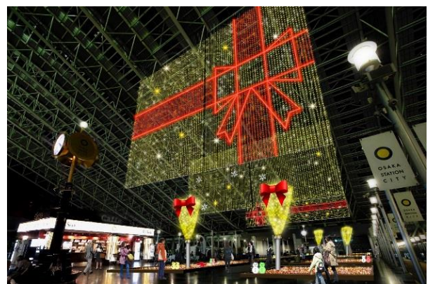
（上）主效果图 （下）透视效果图