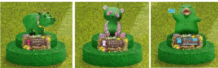
Lucua osaka 캐릭터 '루쿠아노'