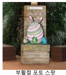
부활절 포토 스팟