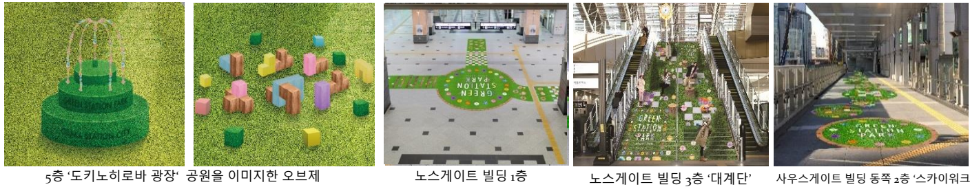
5층 '도키노히로바 광장' 공원을 이미지한 오브제