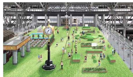
【会場全体イメージ】