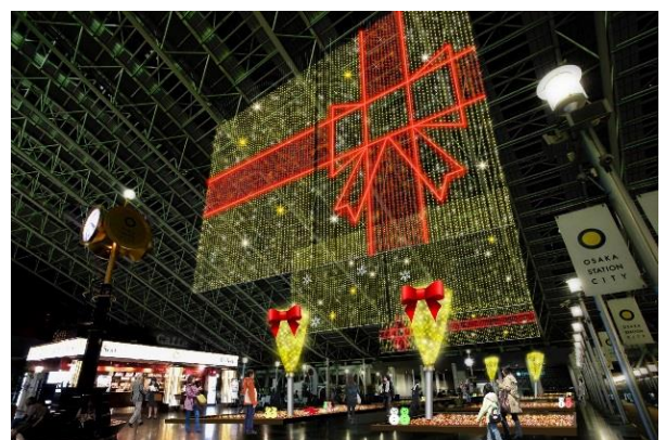
(上) 主要視覺形象 (下) 透視示意圖