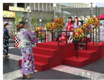
&lt;以花裝飾的人力車&gt;