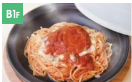
カフェ・バー カフェ&バー ゲーテ 営業時間 9:00~22:30 ☎06-6344-5601