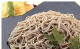
蕎麦と地鶏串焼 弦 ☎06-6346-3908