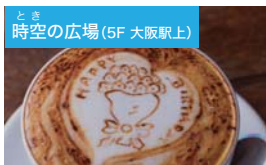
とき 時空の広場 (5F 大阪駅上) カフェ 大阪ステーションシティ パール・デルソーレ 営業時間 8:00~23:00 ☎06-6485-7897