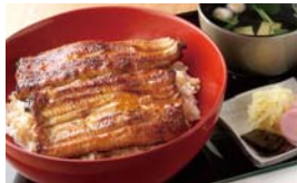
うなぎ・日本料理 大阪竹葉亭 ☎06-6347-1235