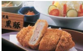
とんかつ専門店 粹花 KYK ☎06-6345-0028