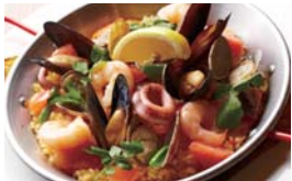
スパニッシュ&メキシカーナ チョコ・アンド・チャーリー ☎06-6347-0303