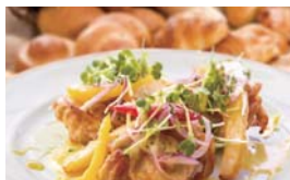
ベーカリーレストラン サンマルク ☎06-6440-7309