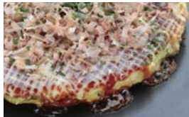
鉄板焼・お好み焼 あ・らん ☎06-6346-5908