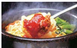
韓国家庭料理 コリアンダイニング シジャン ☎06-4797-3131