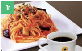
喫茶 カフェ・ド・クレパー 営業時間 6:00~23:00 ☎06-6343-0908