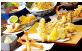
天ぷら料理 銀座ハゲ天 ☎06-6345-1006