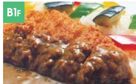
カレーハウス サンマルコ 営業時間 8:00~21:30 ☎06-6341-3050